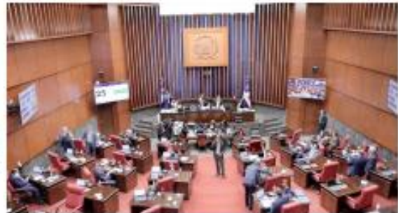
Los legisladores conocieron varias iniciativas de interés nacional. P. 9

La pieza indica, además, que estará conformada por el Estado dominicano, representado por el Ministerio de la Presidencia, en funciones de fideicomiten-