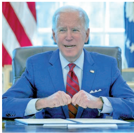
Joe Biden, presidente de EE. UU. F.E.

Al menos dos personas han muerto por disparos de las fuerzas de EE.UU. en el Aeropuerto Kabul. EFE