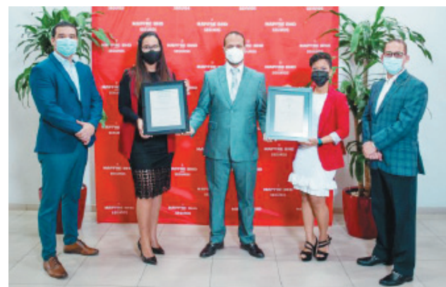
Ejecutivos de Mapfre reciben la certificación de Aenor.

“Esta certificación que recibimos de AENOR, reafirma el compromiso que hemos asumido con nuestros grupos de interés y