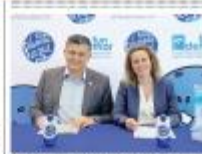
Agua Planeta Azul y Fundemar firmaron ayer un convenio. ■ 6

Paralelo a esta investigación, incluye también identificarlos, rastrearlos y crear líneas para un plan de recuperación y protección de la especie.