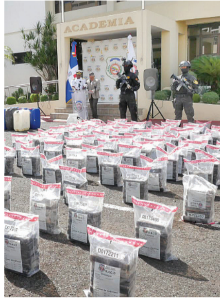
Droga incautada por la DNCD y otros organismos de inteligencia.

Tras abordar la lancha, de 29 pies de eslora, con dos motores fuera de borda