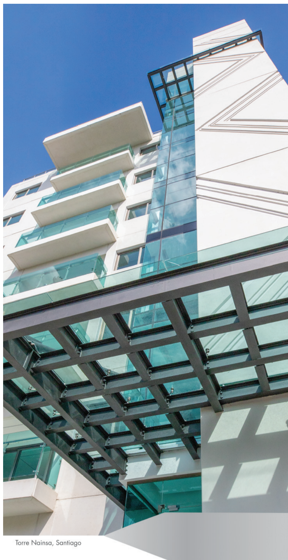
Torre Nainsa, Santiago