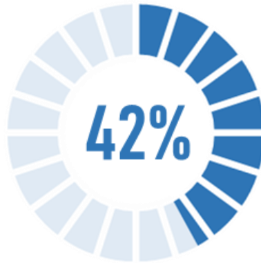
Gráfico 2 Avance Ejecución Financiera del POA con respecto al presupuesto total