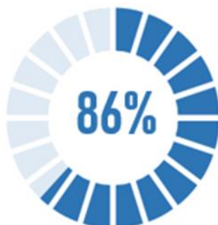
Gráfico 1 Gestión Operativa Iniciada