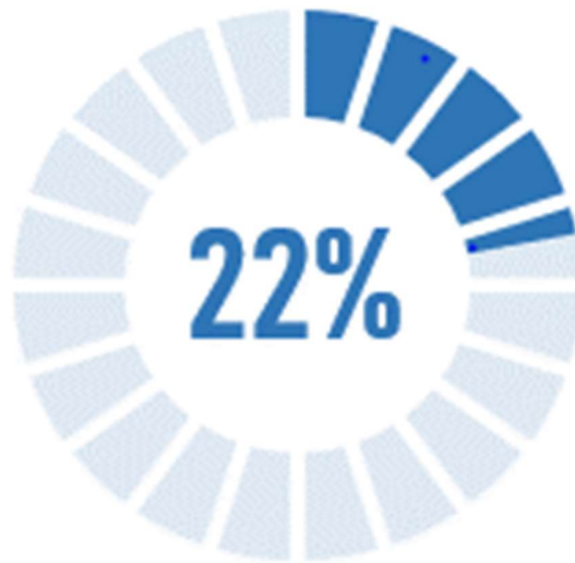
Gráfico 3 Avance Ejecución Financiera del POA con respecto al presupuesto total